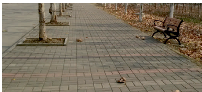
Chodníky a přístupové cesty